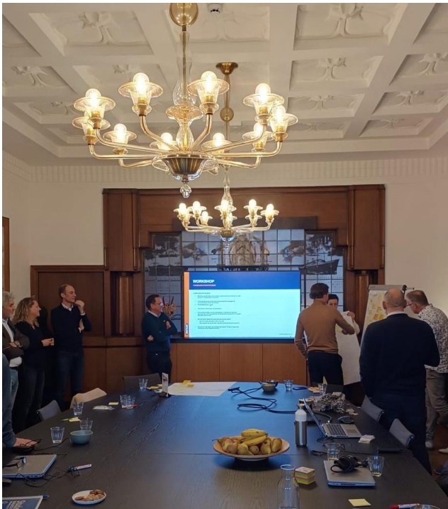
PSU bij RDM Commissariskamer

Op 28 november heeft Swietelsky een Project Start-Up (PSU) georganiseerd voor het Havenbedrijf en ProRail. Het doel van deze bijeenkomst was om de opdracht en onze aanpak te bespreken. De projectteams maakten kennis met elkaar en door middel van de opdracht "Wat kom je halen, wat kom je brengen" werd de manier van samenwerken vormgegeven.