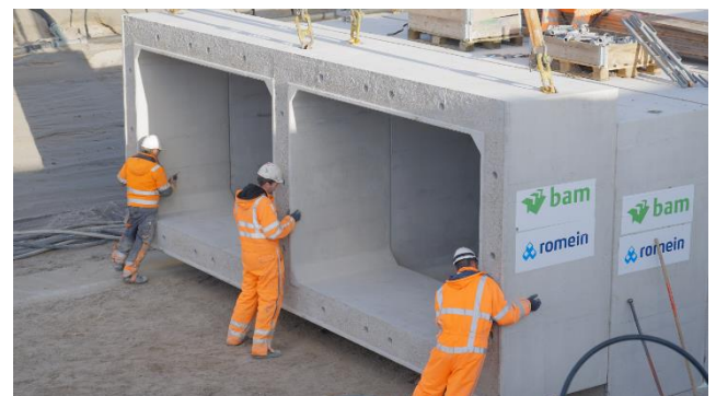
Ondergrondse constructies kabels en leidingen

Er zijn aanpassingen gedaan aan de Stedin kabels en Evides heeft twee nieuwe waterleidingen in één koker gelegd. Hiermee zijn de eerste verleggingen van leidingen een feit.