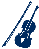
Rotterdams Philharmonisch Orkest