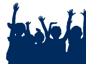
Jeugd Educatie Fonds