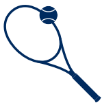
ABN AMRO Open