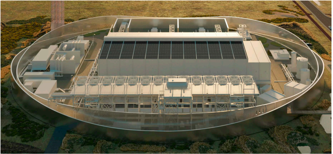
Groene-waterstoffabriek Holland Hydrogen-1