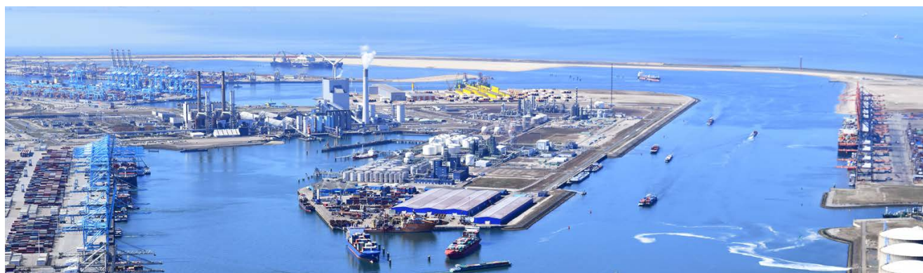
Doorkijk Maasvlakte 2

De materiële vaste activa zijn in de eerste helft van 2022 toegenomen met € 19,6 miljoen door netto-investeringen (€ 94,1 miljoen), uitgaven voor projecten in de ontwikkelingsfase (€ 1,3 miljoen) en afgenomen door afschrijvingen (-/- € 74,2 miljoen), en bijzondere waardeverminderingen (-/- € 0,3 miljoen). De grootste investeringen in het eerste halfjaar van 2022 zijn: de aanleg kademuur Amaliahaven en de landaanwinning op Maasvlakte 2.